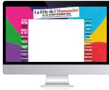
Programmatisation Web (display/vidéo/audio)