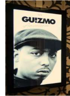
DOOH (affichage extérieur digital)