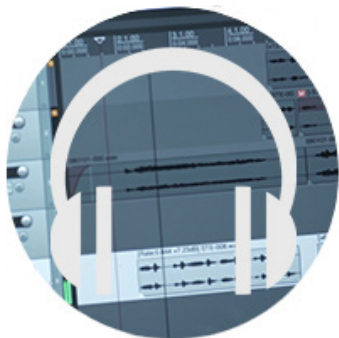
A ECOUTER : LE REPORTAGE SONORE DU COLLEGE PAULETTE BILLA (TINQUEUX, 51)